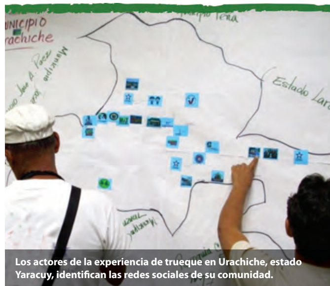
Los actores de la experiencia de trueque en Urachiche, estado Yaracuy, identifican las redes sociales de su comunidad.