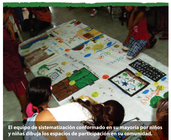
El equipo de sistematización conformado en su mayoría por niños y niñas dibuja los espacios de participación en su comunidad.

Identificar o resaltar en el mapa social que se ha creado de forma colectiva en los pasos anteriores, las fuerzas sociales de la comunidad que forman parte de la construcción del poder popular que ha ejercido la experiencia desde su creación hasta los momentos a través de la pregunta: ¿qué aportes ha propuesto la experiencia en la construcción del poder popular en la comunidad? Discutir para ello el rol de la experiencia