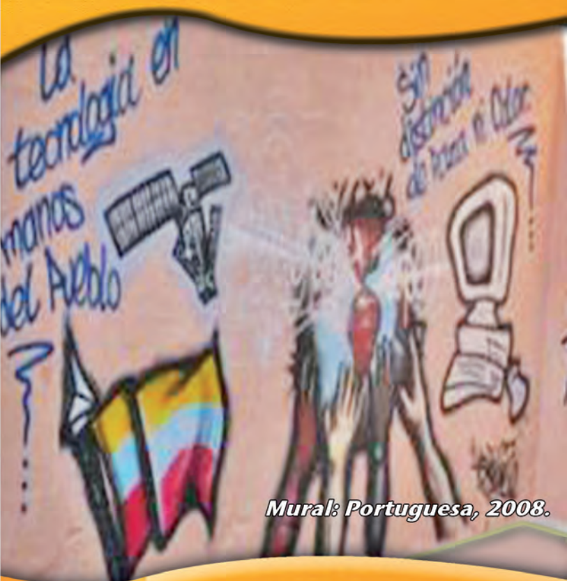
Mural: Portuguesa, 2008.